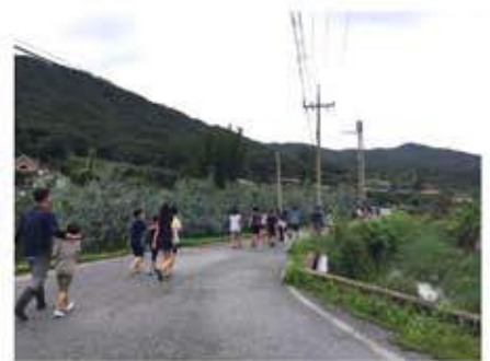
한살림 사과밭을 향해~