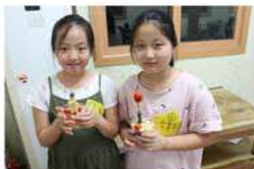
간식으로 과일화분 만들기.