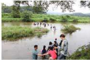
준비운동을 하고 물놀이 시작!