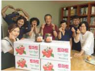
솔피 생산자 사무국 방문