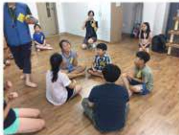
관계 형성 놀이로 서로 알아보고 친밀해 지는 시간.