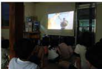
한살림 사과는 어떻게 생산될까?