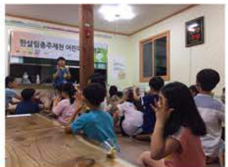
혼자하는 실뜨기 놀이도 배웠어요.