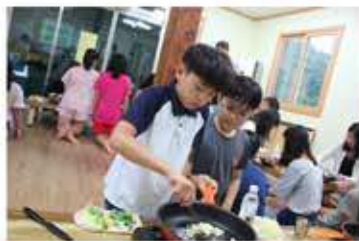
불고기 덮밥을 만들어요. 재료도 썰어보고 직접 볶으면서~