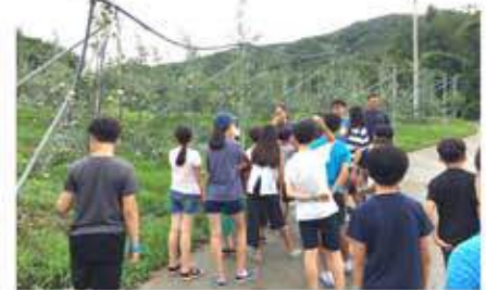
아오리 사과 직접 따먹기