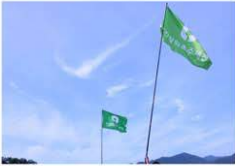
비온 뒤 맑은 하늘