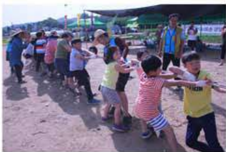
수원 vs 흥주제천 줄다리기