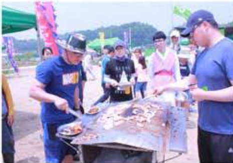
생산자와 실무자가 구어주는 삼겹살