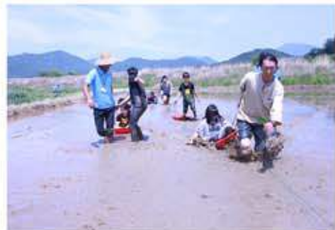
어른들이 끌어주는 논썰매