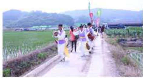
희양산 공동체 길놀이