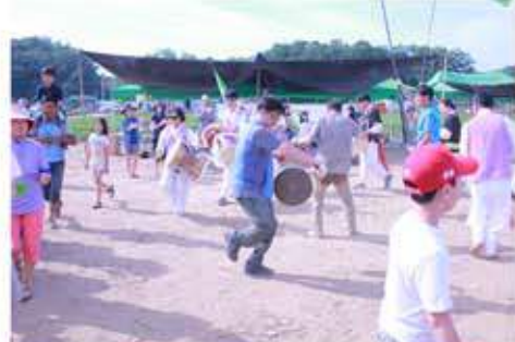
신명나는 장단과 함께 마무리